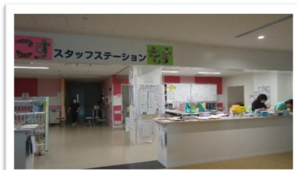
スタッフステーション